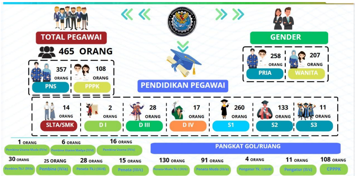
Gambar 2 Rincian Jumlah Pegawai Lingkup Kemenko Infra

Sejak ditetapkan Peraturan Presiden Nomor 145 Tahun 2024 tentang Kementerian Koordinator Bidang Infrastruktur dan Pembangunan Kewilayahan, Kemenko Infra sampai dengan saat ini memiliki 465 pegawai terdiri dari 258 pegawai berjenis kelamin laki-laki dan perempuan, dengan rincian PNS 357 pegawai dan Calon Tenaga PPPK 108 pegawai. Jumlah pegawai berstatus PNS berjenis kelamin laki-laki 258 orang, dan perempuan 207 orang. Adapun rinciannya sebagai berikut: